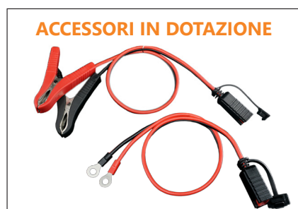
ACCESSORI IN DOTAZIONE